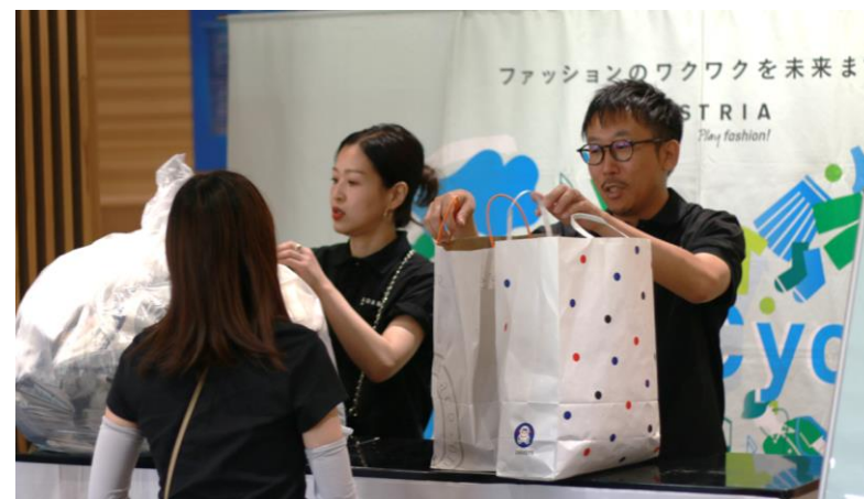
着なくなった衣料品の回収 (2日間で355組、約3,500枚の衣料品を回収)

※開催内容URL: https://www.adastria.co.jp/bazaar2023/