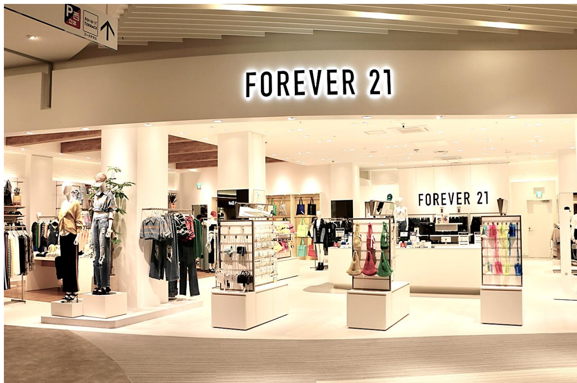
「ららぽーと門真店」