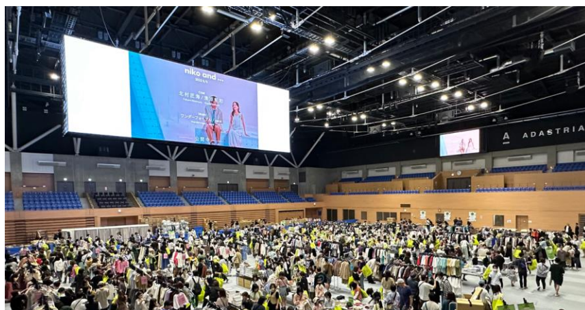
ファミリーガレージセール