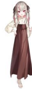
魔界ノリりむ LOWRYS FARM